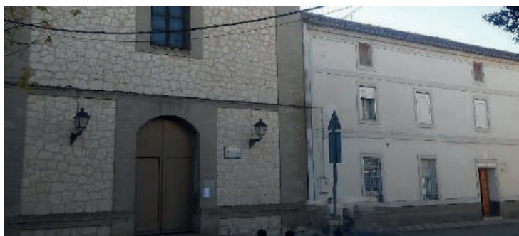
CONVENTO DE NUESTRA SEÑORA DE LOS DOLORES FRANCISCANOS. Calle Grande, 68, 45800 Quintanar de la Orden, Toledo.