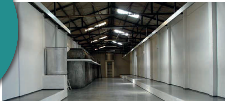
ESPACIO-ARTE EL DORADO. FUNDACIÓN AMELIA MORENO. Avda. del IV Centenario, s/n · 45800 Quintanar de la Orden, Toledo.