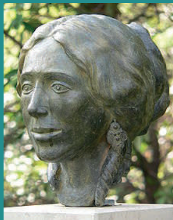
Busto de Pauline García Viardot en Baden-Baden.

P aulina García Sitches, conocida también como Michelle Pauline Viardot García (París, 18 de julio de 1821-París, 18 de mayo de 1910), fue una cantante de ópera (mezzosoprano) y compositora francesa. De origen español, era hija del tenor y maestro del bel canto Manuel García y de la soprano Joaquina Briones, además de hermana de la diva María Malibrán y del influyente barítono y maestro de canto Manuel Patricio García, inventor del laringoscopio.