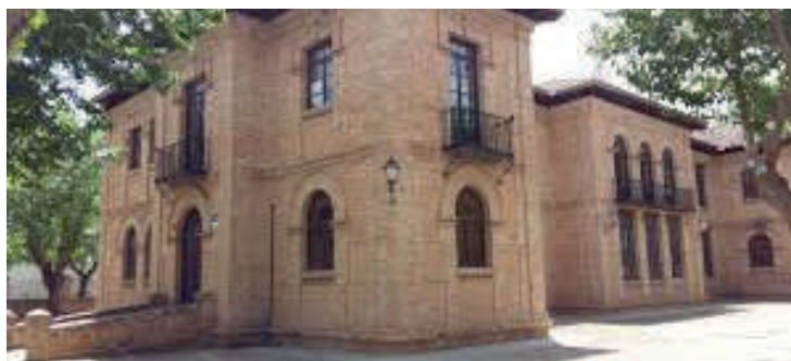
ESCUELA MUNICIPAL DE MÚSICA. Colón Parque. Quintanar de la Orden, Toledo.