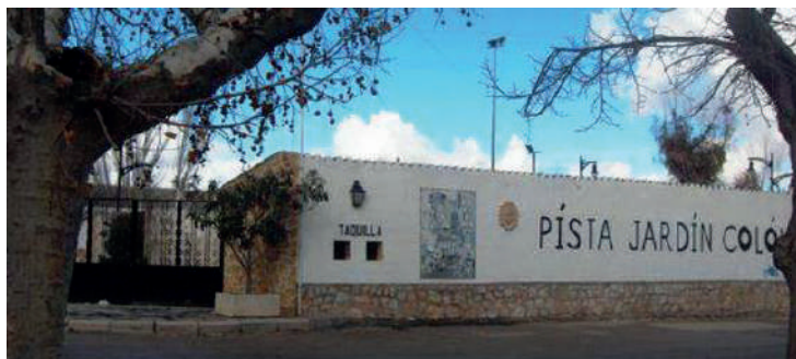
PISTA JARDÍN COLÓN. San Bartolomé, s/n, C.P. 45800, Quintanar de la Orden, Toledo.